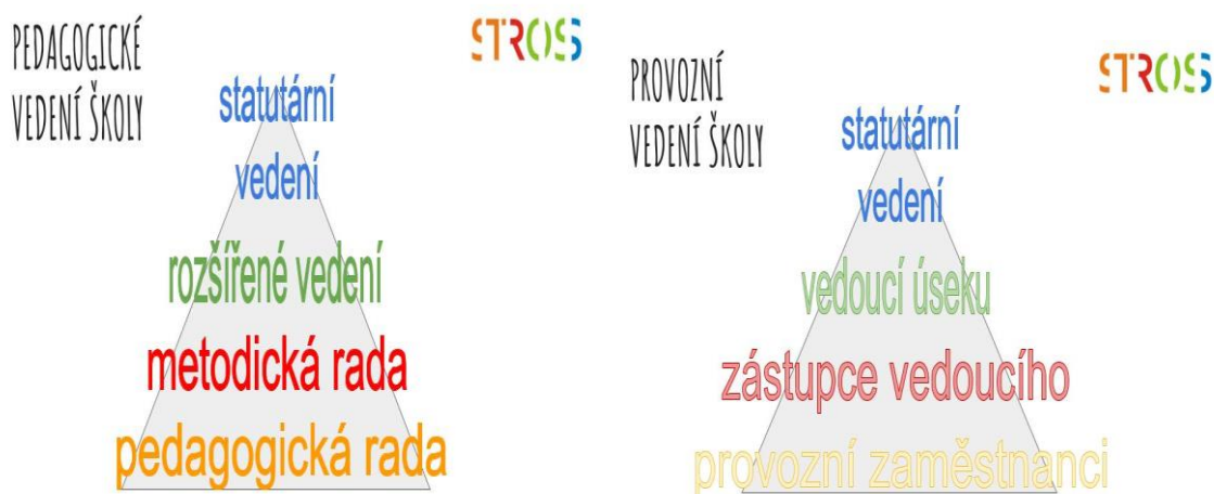
SCHÉMA VEDENÍ ŠKOLY